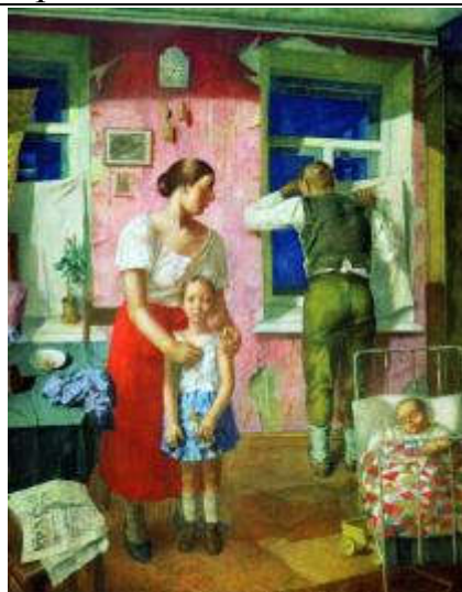
Петров-Водкин К.С. 1918 год. Тревога