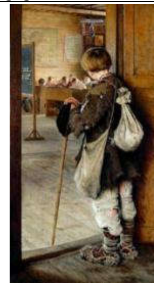
Богданов-Бельский Н.П. У дверей школы