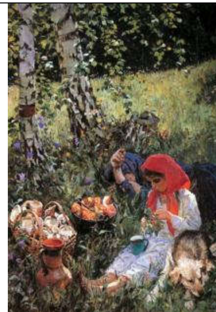
Пластов А.А. Летом. Грибы