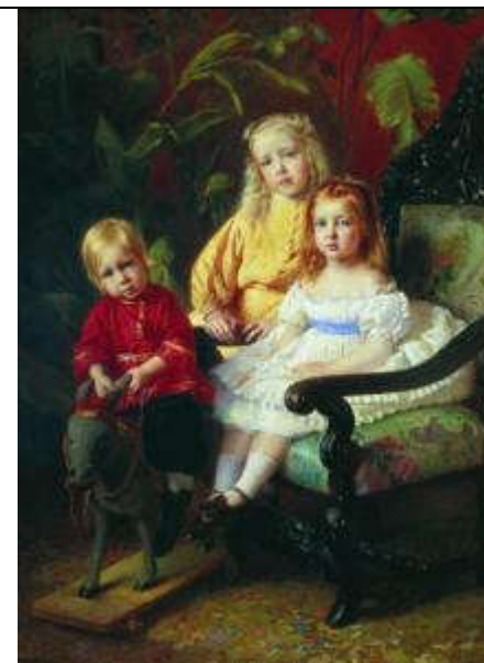
Маковский К.Е. Портрет детей Стасовых