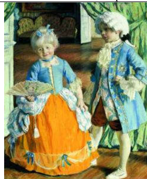
Кустодиев Б.М. Дети в маскарадных костюмах