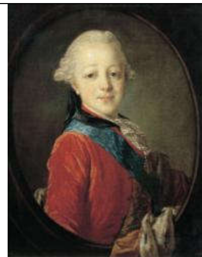
Рокотов Ф.С. Портрет великого князя Павла Петровича в детстве