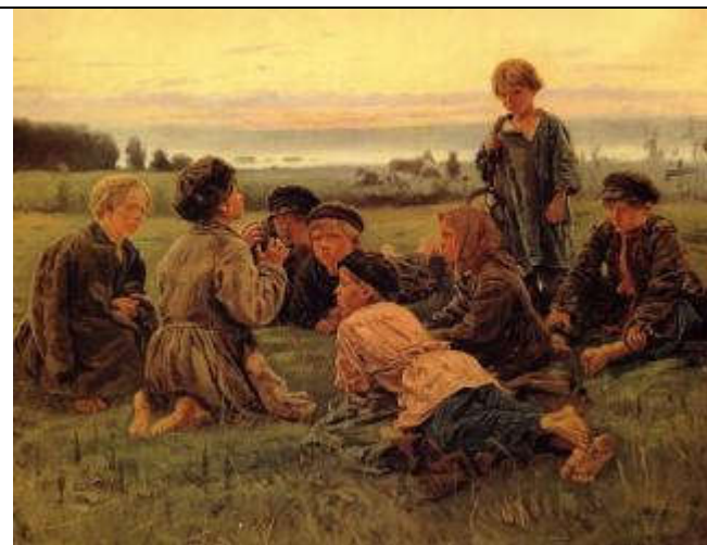
Маковский В.Е. Ночное