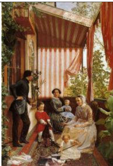
Славянский Ф.М. Семейная картина