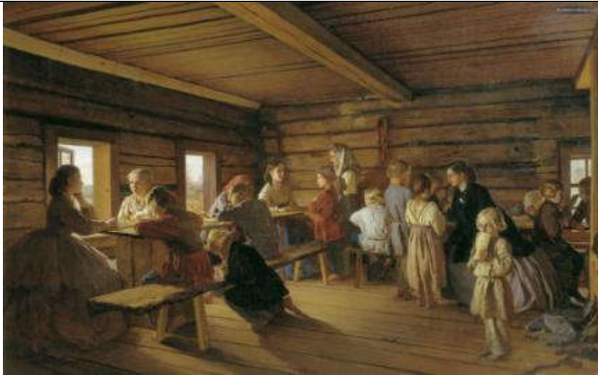
Морозов А.И. Сельская бесплатная школа