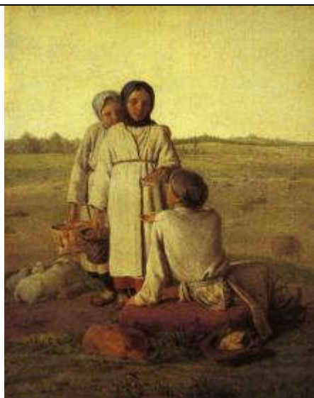
Венецианов А.Г. Крестьянские дети в поле