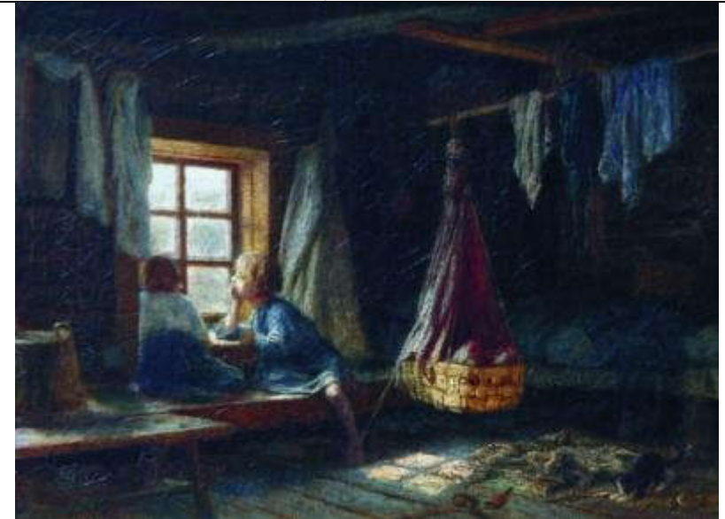
Савицкий К.А. Дети в избе