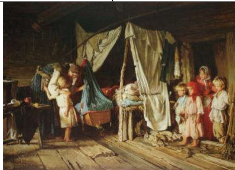
Лемох К.В. Новое знакомство