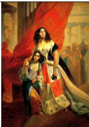
Брюллов К.П. Портрет графини Ю.П.Самойловой, удаляющейся с бала с приемной дочерью Амацилией Пачини