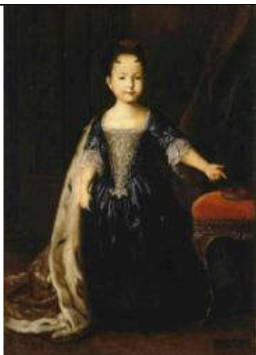
Каравак Луи. Портрет цесаревны Натальи Петровны