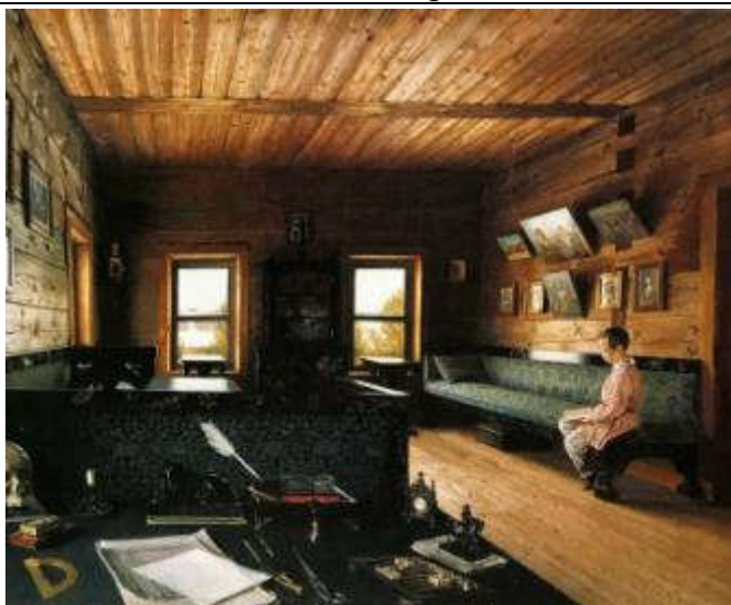
Сорока Г.В. Кабинет дома в «Островках»